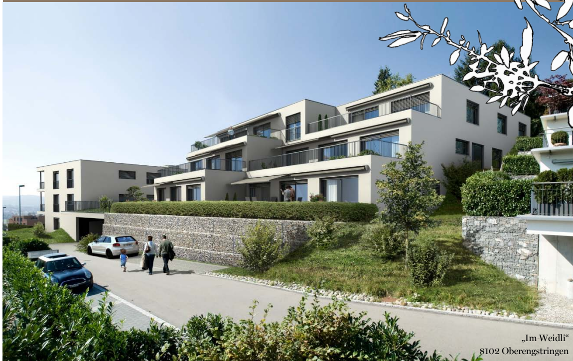
„Im Weidli“ 8102 Oberengstringen