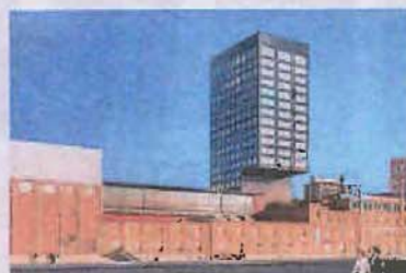
Schwarz und elegant: Das Hochhaus, 70 Meter hoch über der alten Brauerei.